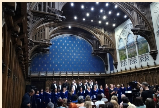
Corul Academic „Gavriil Musicescu” – Filarmonica de Stat „Moldova” Iași, Sala „Henri Coandă” (2022)