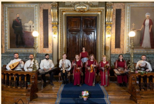
Ansamblul Coral „Floralia”, Aula Magna „Carmen Sylva” a Universității Tehnice „Gheorghe Asachi” Iași