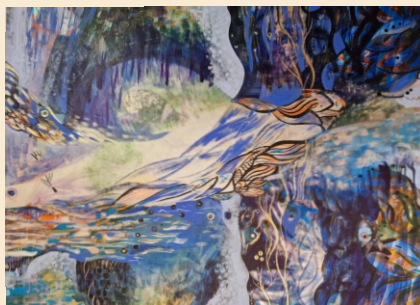
Expoziția de pictură „El Amor”