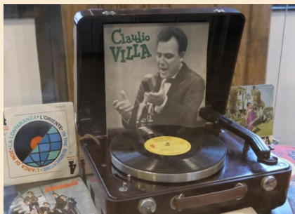
Expoziția „Electrecord. O poveste de succes”

Palatul Culturii - Muzeul Științei și Tehnicii „Ștefan Procopiu”