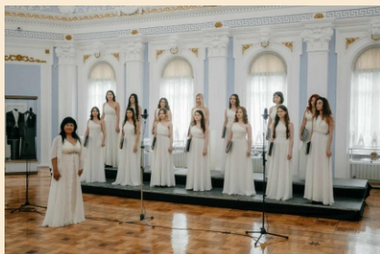
Ansamblul coral „Cantabile”, Academia de Studii Economice din Chișinău (Republica Moldova)