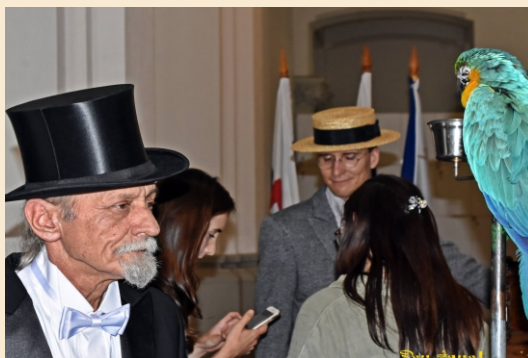
Flașnetari din Polonia în recital