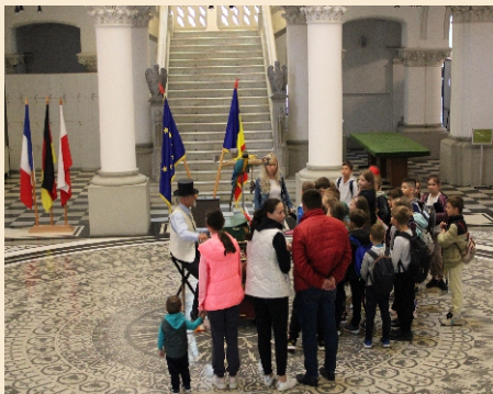
Holul Central al Palatului Culturii Iași - Momente muzicale susținute de flașnetari