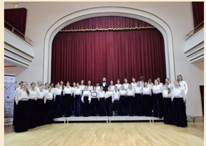
Ansamblul Coral „Waldorfia”

- El Amor , artă plastică decorativă Autor: Carmen Vînașu - artist vizual Palatul Culturii - Muzeul Științei și Tehnicii „Ștefan Procopiu”